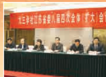
▲ 12月21日，九三学社江苏省委八届四次全体(扩大)会议开幕