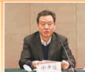
▲ 中共江苏省委统战部副部长徐开信应邀出席会议并讲话