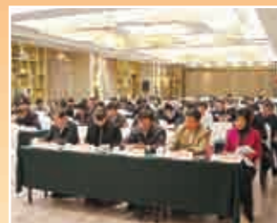
▲ 九三学社江苏省委八届四次全体(扩大)会议现场

12月21日至22日，九三学社江苏省委八届四次全体(扩大)会议在南京召开。九三学社江苏省委主委周岚代表九三学社江苏省委八届委员会常务委员会作工作报告。中共江苏省委统战部副部长徐开信应邀出席会议并讲话。