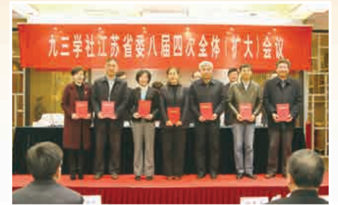
表彰社省委 2019 年度先进集体和先进个人